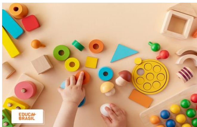
Figura 01 – Primeira infância