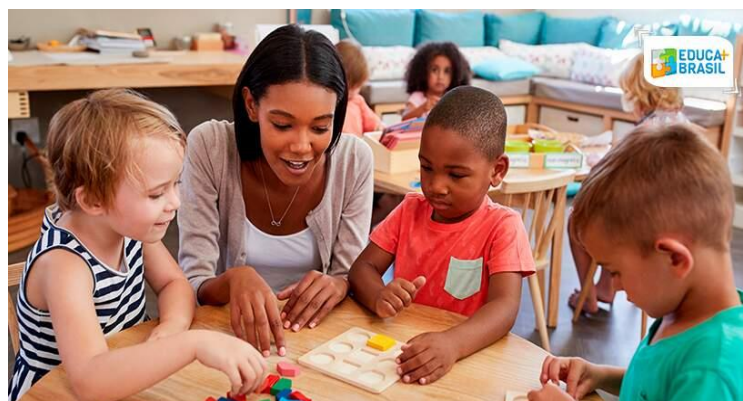
Figura 07 - A importância da alfabetização e letramento