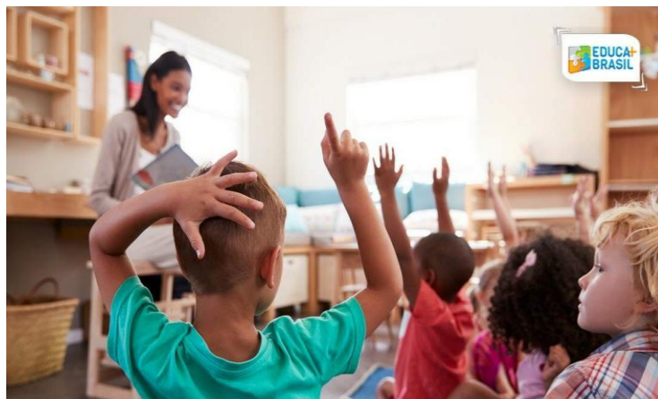
Figura 06 - A importância da alfabetização e letramento