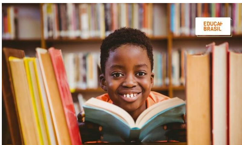
Figura 05 - A importância da alfabetização e letramento