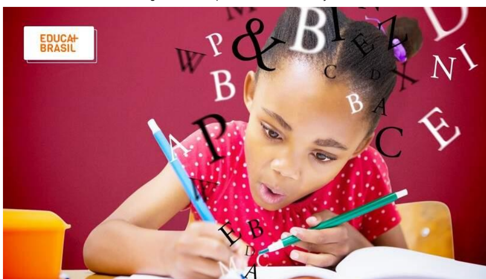
Figura 02 - A importância da alfabetização e letramento