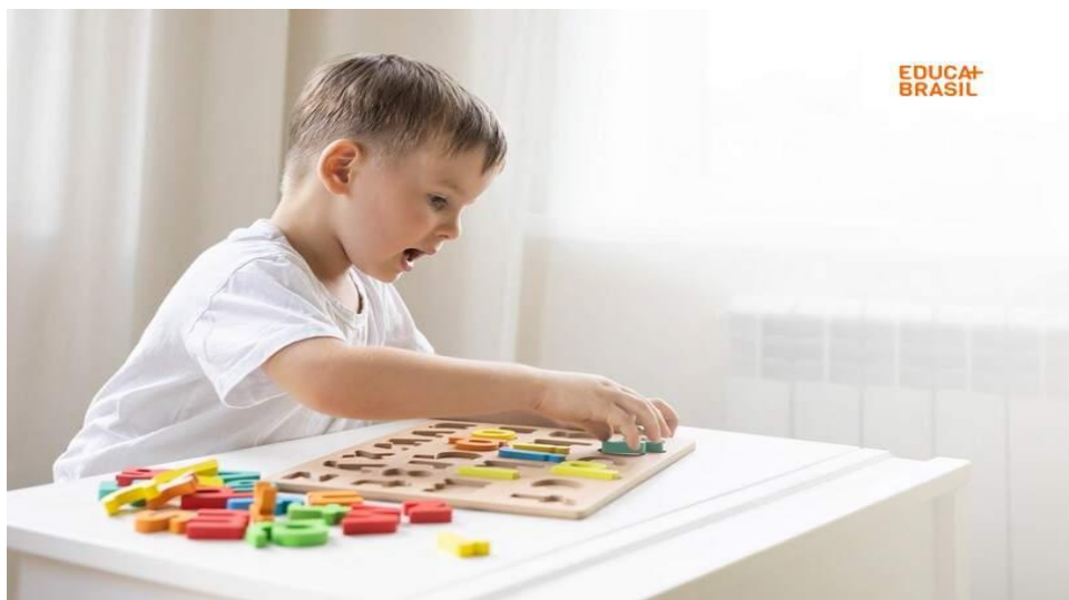
Figura 03 - A importância da alfabetização e letramento